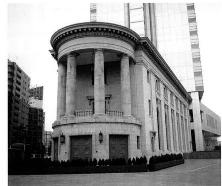
曳き屋して旧横浜銀行本店別館（元第一銀行横浜支店）遺して高層再開発し政策価値を高めた例