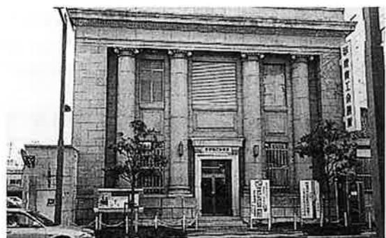
無き旧甲府商会議所 S4年