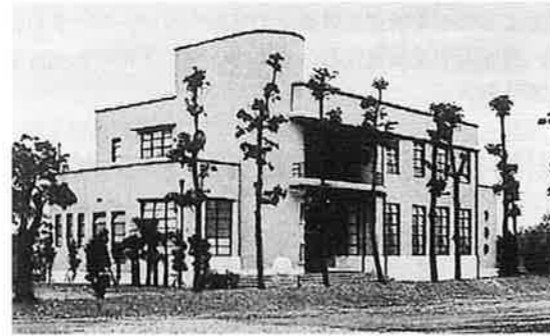
県庁南第二別館 S5年