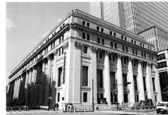
三井本館を遺して高層再開発した。企業価値を高めた例

あらためて歴史的建造物の価値を見直し、今生きている私たちの町のアイデンティティーや誇りを取り戻したまちを創り続ける基盤をつくる時が来ている。横浜市都市整備局都市デザイン室（「歴史を活かした街づくり要綱」を昭和63年（平成元年）より実施施行している）などの行政価値を高めている政策から見ると、周回遅れの感は否めずとも気付いたときから始めるしかない。進取に富む気質のある人々も目新しさだけの町の味気なさにはもううんざりしている。甲府のまちの再生は、都市の遺伝子をつなぎながらの他に見当たらない。