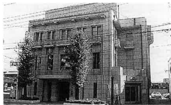
甲府法人会館 T15 (S1) 年

その後、意識ある市民やつなぐNPOより、そのツアーを企画したいと依頼され、9月5日実現した。約50名以上の老若男女が参加された。そのなかでも圧巻は、山梨文化会館（都市のインフラとしての建築）では、いま類似コンセプトのイタリアポローニャ・フィエラセンターでは30年経ていまいやく立ち上がって建築途中のこのエピソードや、旧県庁本館の帝冠様式（最上階に天皇陛下のお写真を祀る「正庁＝奉安殿」のある）・議事堂等とコルビジェを代表するモダニズム建築家たちも傾倒したオランダのディ・スティル派（幾何学的美学）や分離派（表現派・建築造形運動）の影響を受けた作風である旧県立図書館（県庁第一南別館）が激動の昭和4・5年竣工の時期を同じくして対峙して建築されていることの重要性と、戦前（活況を呈していた大正・昭和初期デモクラシー）、戦後の歴史を留める正反対のライフスタイルの現象が表現されていることを通して、甲府の文化の厚みなどを参加者と時空のなかで共感できたことであった。なかでも「甲府の町も一流の文化が遺っていて安心した」といわれた方々のお言葉が今でも心に響いている。