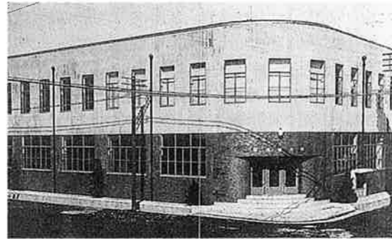
甲府市庁舎南別館所 S4年